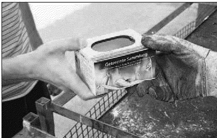
Die Batteriensammelbox kommt per Post in jeden Vorarlberger Haushalt und erleichtert zukünftig das Sammeln.

Nur rund 40 Prozent der gekauften Gerätebatterien werden laut Elektroaltgeräte-Koordinierungsstelle derzeit bei den Händlern oder Problemstoffsammelstellen der